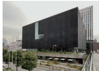
大阪中之島美術館