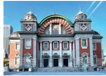
大阪市中央公会堂