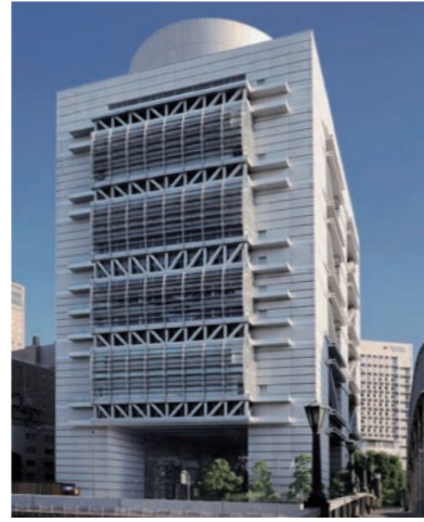
会場…グランキューブ大阪