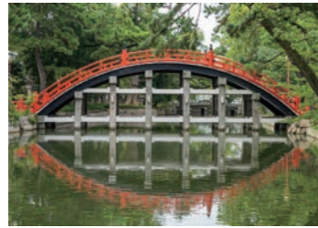
住吉大社反橋(太鼓橋)