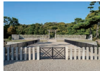
仁徳天皇陵古墳(大仙古墳)