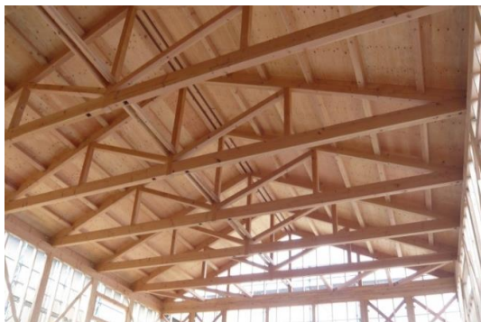
流通製材と住宅用プレカットによる12mスパン 山形トラス