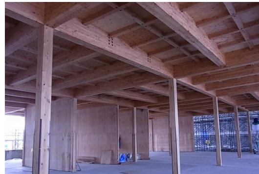
中断面集成材と住宅用梁受金物による6mグリッド 2階床組+高倍率耐力壁