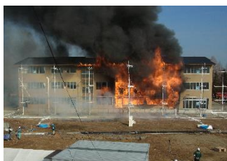
木造3階建て校舎の実大火災実験

1968年京都市生まれ。1993年東京理科大学理工学研究科建築学専攻修了後、積水ハウス入社。1999年桜設計集団一級建築士事務所設立。2021年よりNPO法人 Team Timberizeの理事長を務めながら、全国各地で木造の防耐火設計や技術開発・研究開発に携わっている。