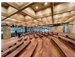
神山まるごと高専 大埜地校舎 (設計：shushi architects 吉田周一郎 石川静+須磨一清/ 撮影：藤井浩司 (TOREAL))