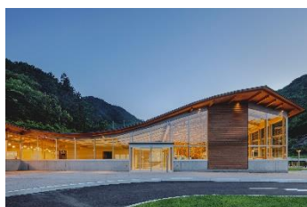
まきのさんの道の駅・佐川 (設計：若竹まちづくり研究所・ STUDIO YY・ワークステーション/)