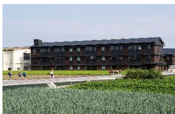
魚津市立星の杜小学校