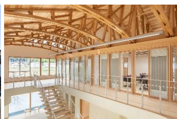
吉住工務店 新社屋 (設計：吉住工務店+NPO 法人物ノド'ウズ + K. 建築社)