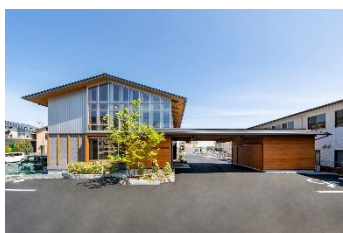
滋賀県林業会館 (設計：宮村太設計工房)