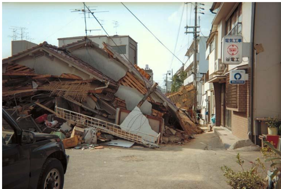
《地震で全壊した木造住宅》